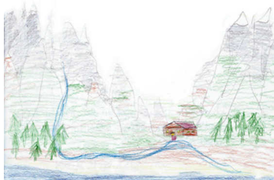
links Cassandras und rechts Johannas Vision (5. Klasse)