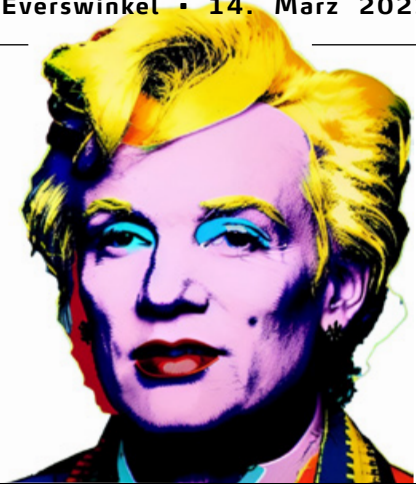
Illustration: Andy Warhol im Stil von Andy Warhol